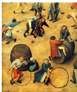
Pieter Breugel d.ä. Detalj ur Lekande barn 1560