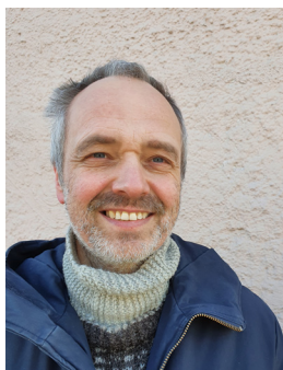
Anders Flækøy Landmark

Landmark, A.F. (2021). Psykodynamisk terapi for barn . Oslo: Gyldendal norsk forlag.